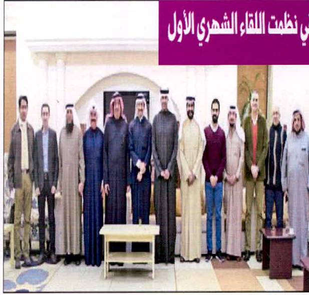
صورة جماعية لأعضاء هيئة التدريس بتوسطهم المضيف