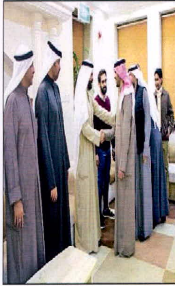
جانب من استقبال الحضور